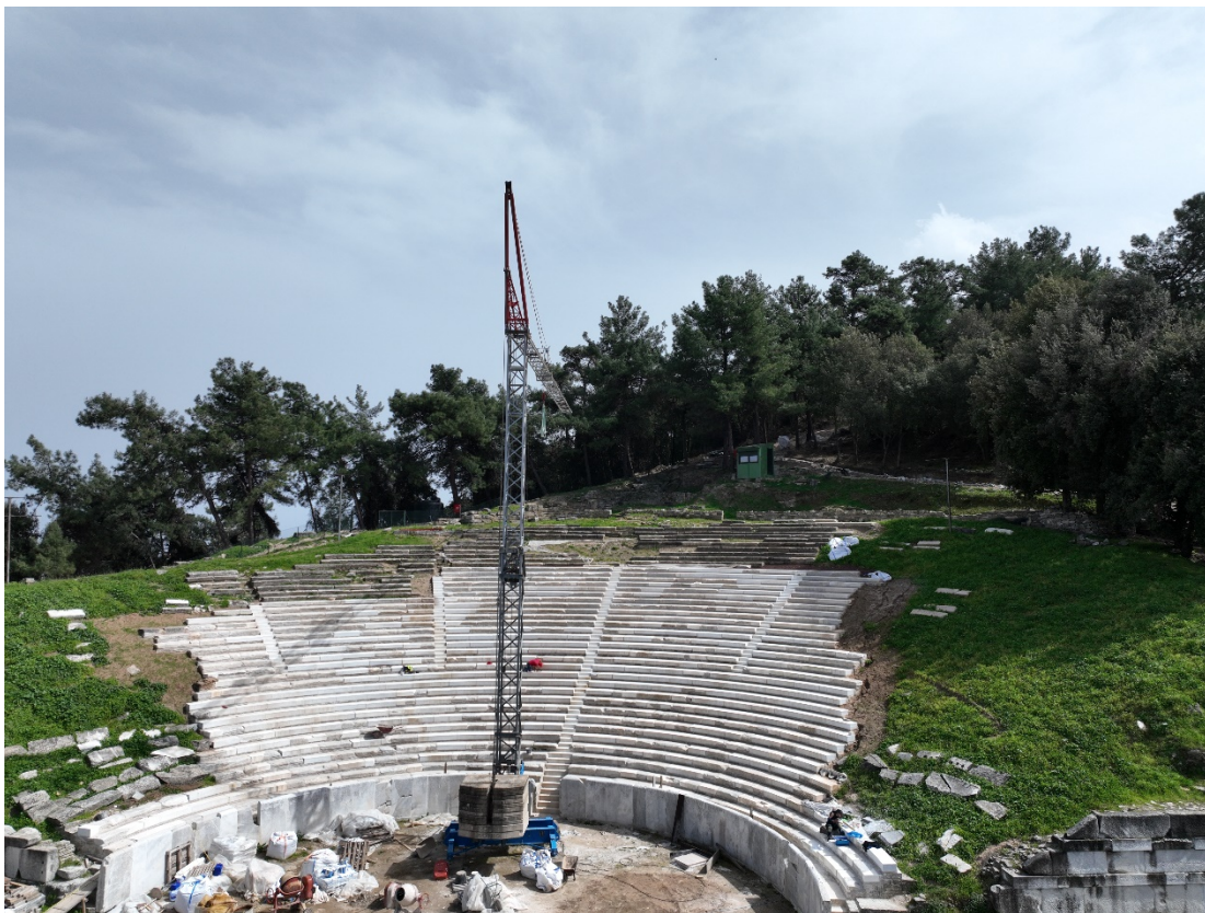
Εικόνα 2. Ο γερανός πύργος μάρκας König K28S, όπως είναι σήμερα στην ορχήστρα του αρχαίου θεάτρου Θάσου