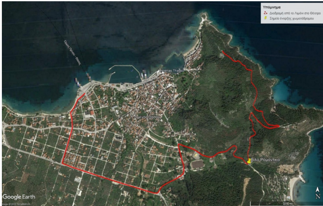
Εικόνα 1. Η διαδρομή από το Λιμάνι στο Αρχαίο θέατρο της Θάσου