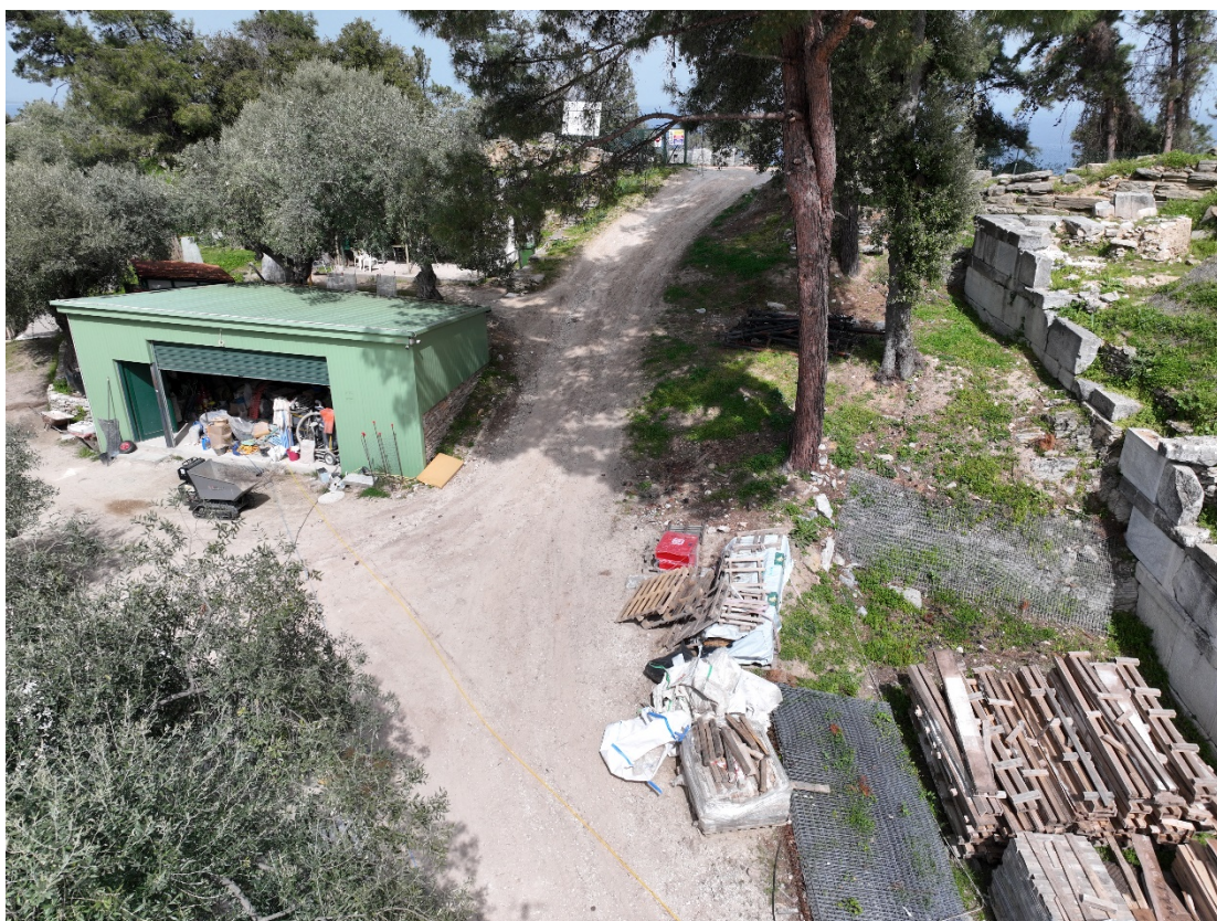
Εικόνα 5. Η κλίση τμήματος της διαδρομής που πρέπει να μεταφερθεί ο γερανός