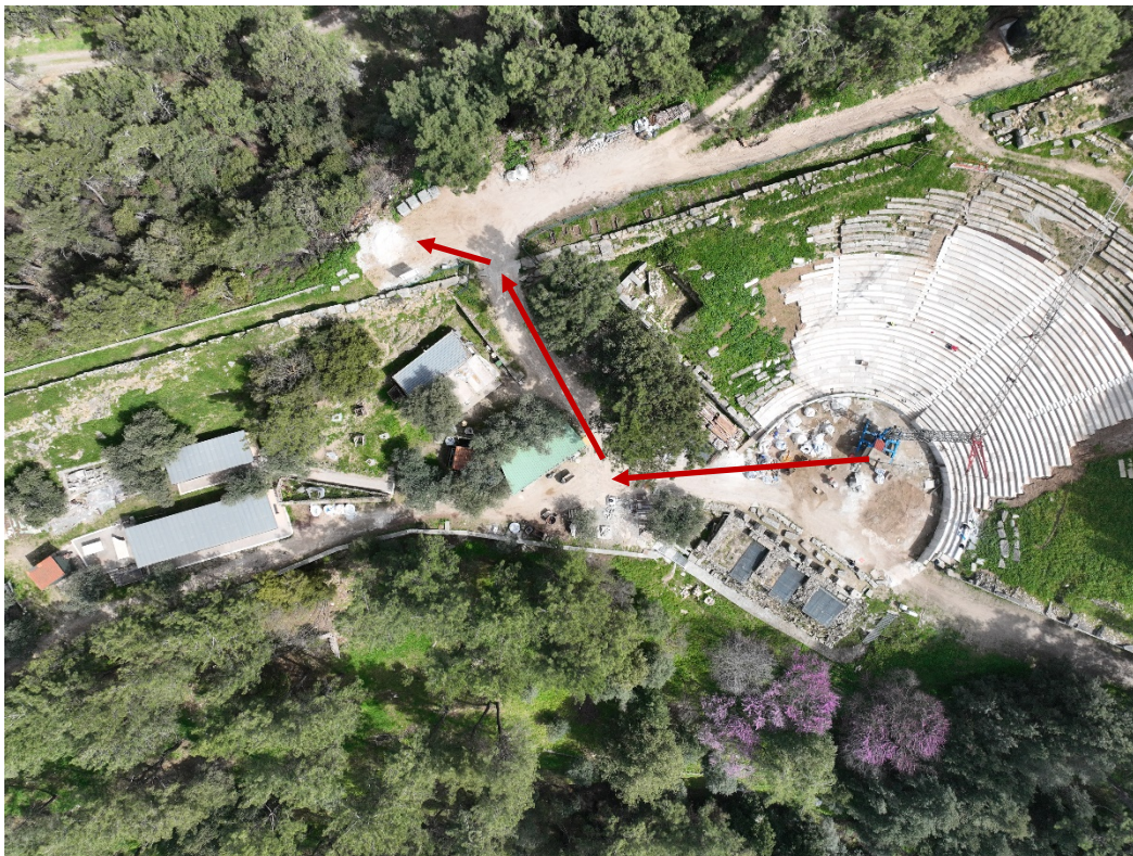
Εικόνα 4. Η διαδρομή που πρέπει να μεταφερθεί ο γερανός