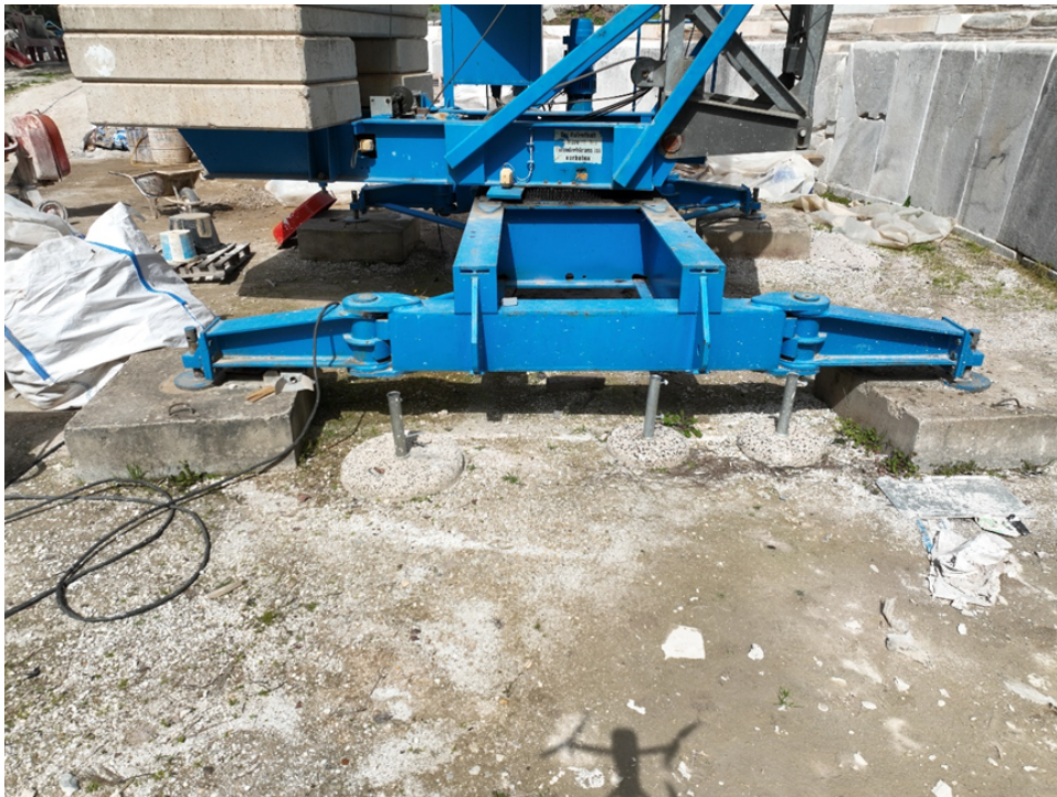
Εικόνα 3. Οι βάσεις πάνω στις οποίες πατά ο γερανός